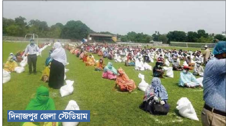
দিনাজপুর জেলা স্টেডিয়াম