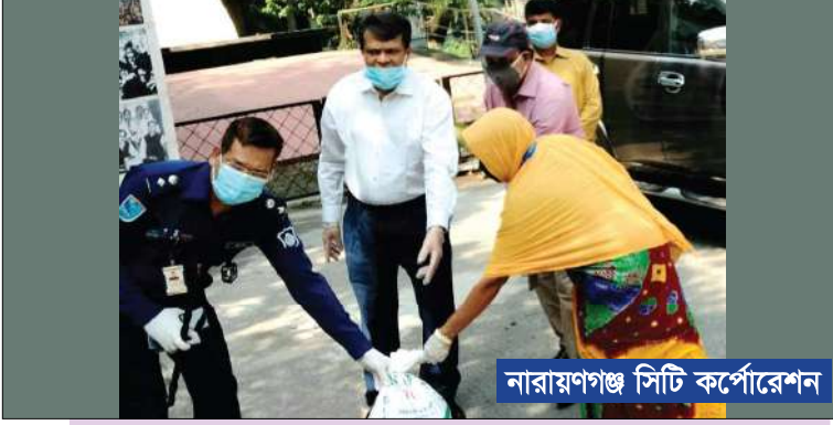
নারায়ণগঞ্জ সিটি কর্পোরেশন

দুর্যোগে | প্রণোদনা ঋণ মানুষের পাশে | খাদ্য সহায়তা বুরো বাংলাদেশ | স্বাস্থ্য সুরক্ষা সামগ্রী