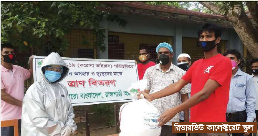
রিভারভিউ কালেক্টরেট স্কুল