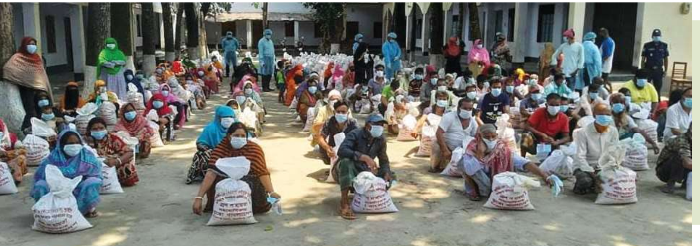
সিরাজগঞ্জ পৌরসভার অসহায় ও দুস্থ পরিবারের মধ্যে করোনা পরিস্থিতিতে জেলা প্রশাসনের সহযোগিতায় জরুরি দ্রাণ বিতরণ।