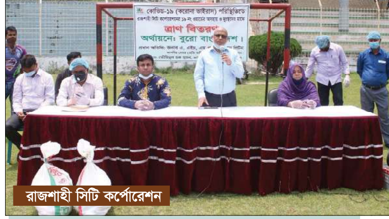
রাজশাহী সিটি কর্পোরেশন