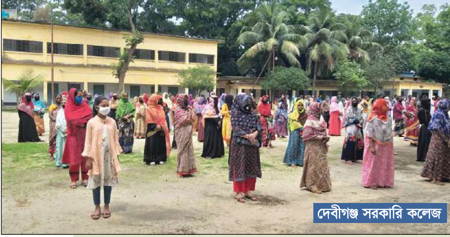
দেবীগঞ্জ সরকারি কলেজ

দুর্যোগে | প্রণোদনা ঋণ মানুষের পাশে | খাদ্য সহায়তা বুরো বাংলাদেশ | স্বাস্থ্য সুরক্ষা সামগ্রী